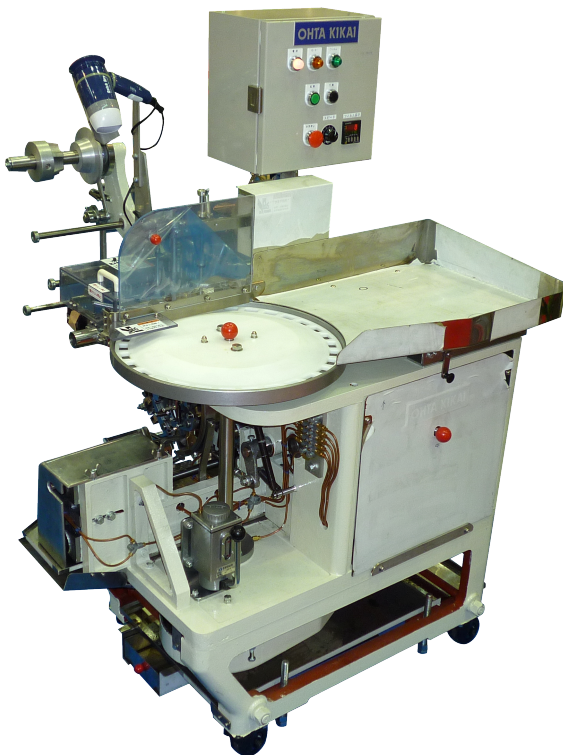
生キャラメル専用機 (両ヒネリ包装)

※製造する商品によって動力、カッター刃、シートサイズなどが変わります。(仕様はお打合せ要)